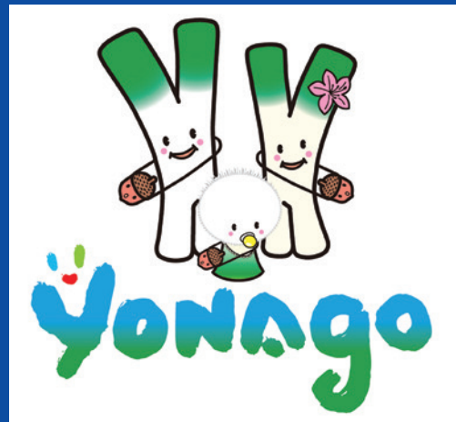
米子市イメージキャラクター「ヨネギーズ」

※ 図に示す避難経路は、代表的な経路の例示になります。 避難にあたっては、実際の交通状況や現地の誘導に従って走行してください。 ※ 車で避難する際のカーナビゲーション入力用として電話番号をご利用ください。