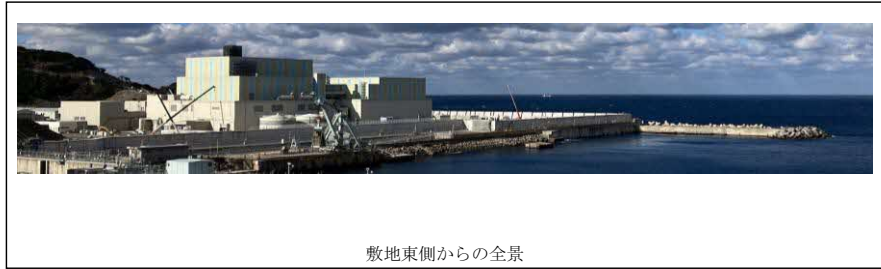
敷地東側からの全景

新規制基準を踏まえた安全対策工事を実施していること等から、今後の建設工程が確定しないため、進捗率については建設工程が確定した後にお知らせします。