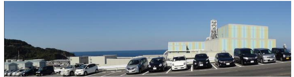
敷地南側からの全景