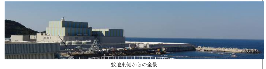
敷地東側からの全景