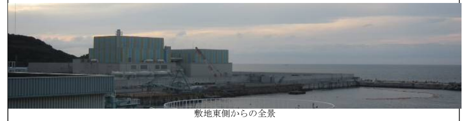
敷地東側からの全景