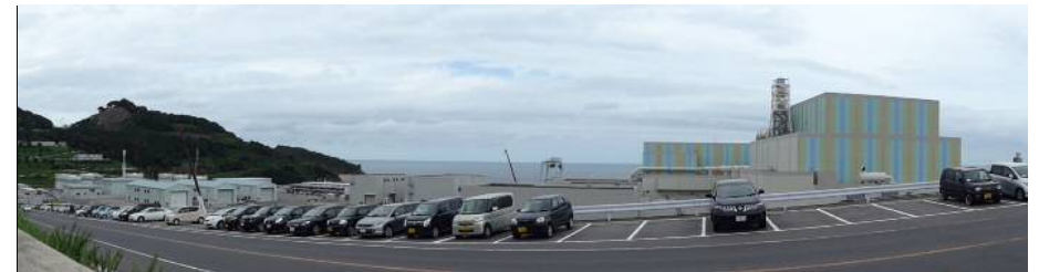
敷地南側からの全景