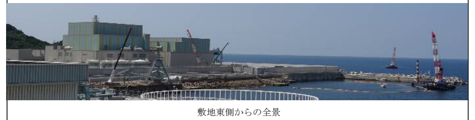
敷地東側からの全景