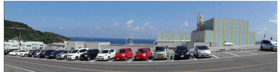
敷地南側からの全景