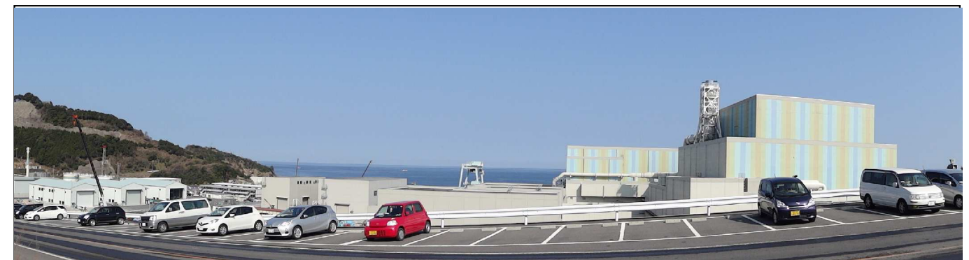
敷地南側からの全景