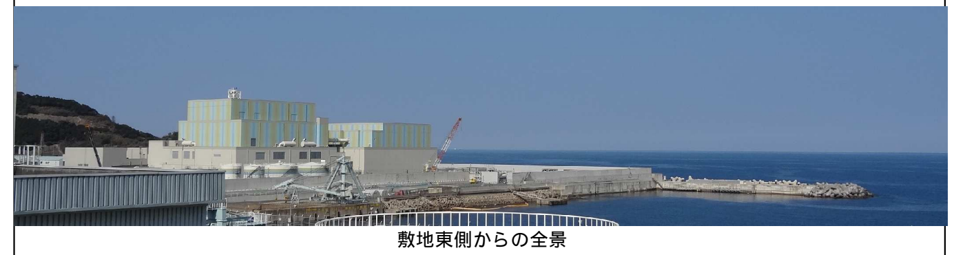
敷地東側からの全景