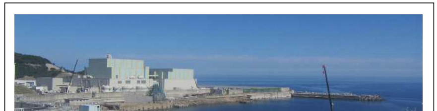
敷地東側からの全景