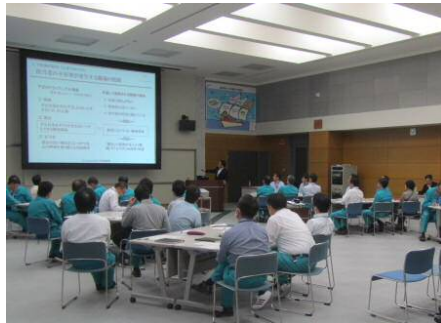
講師から「職場から不祥事を出さない管理者の責務と実務のポイント」について講演