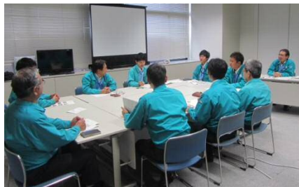
本事案の事例研修では、以下のような視点から話し合いを実施 ・自らの職場で同様の事案を発生させないためにどう取り組むのか ・地域の皆さまからの信頼回復に向けてどう取り組むか