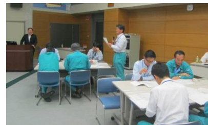
業務管理や部下とのコミュニケーションについて、グループで話し合い、発表