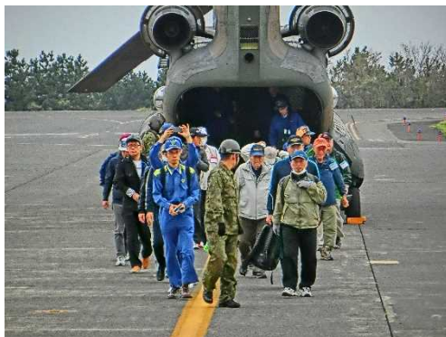
大型ヘリによる避難