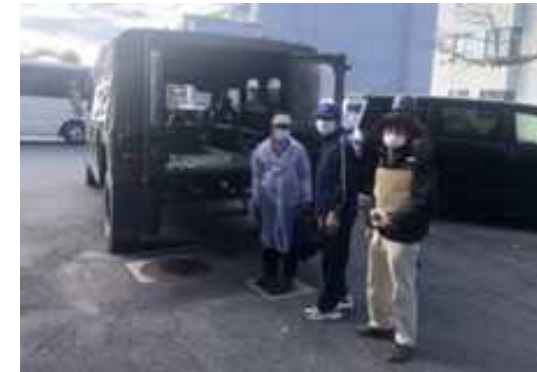
陸上自衛隊車両による避難