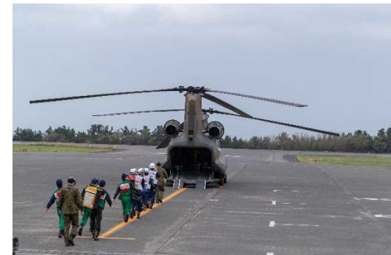
医療関係者の緊急輸送