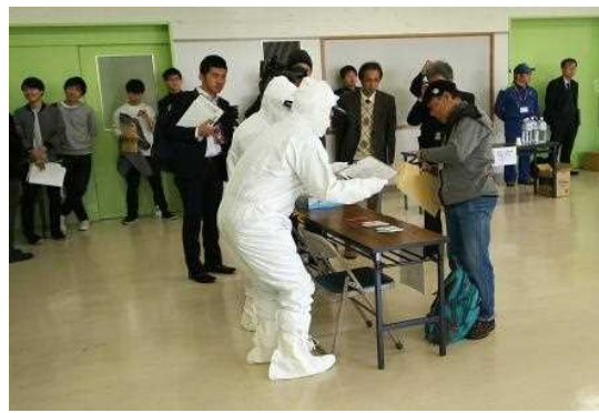
安定ヨウ素剤配布訓練