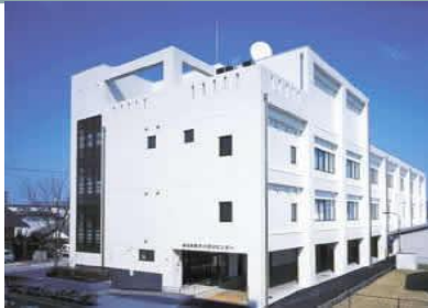
島根県原子力防災センター