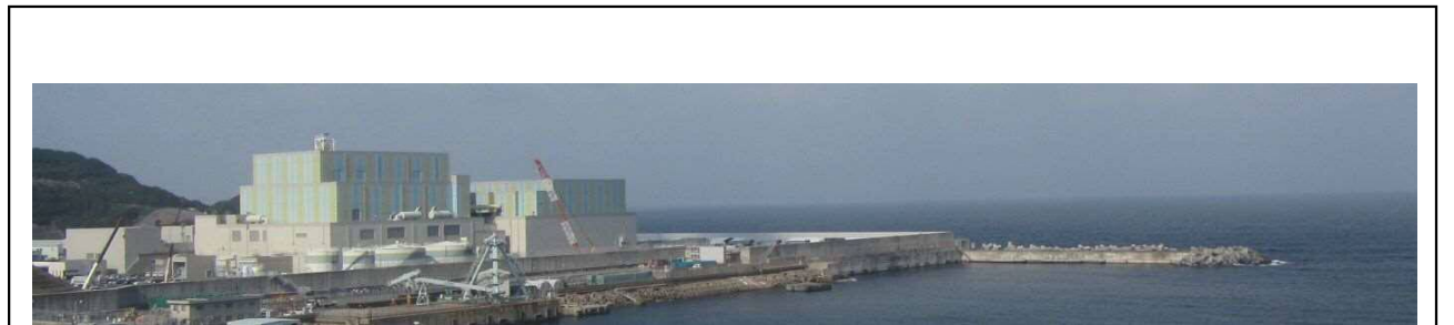
敷地東側からの全景