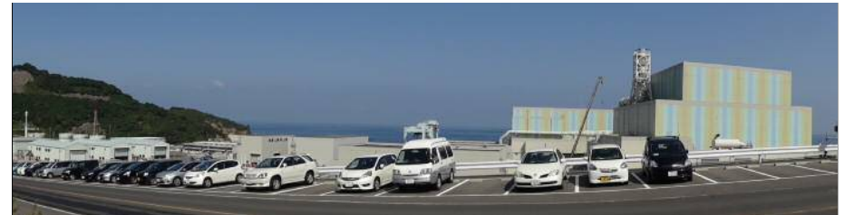
敷地南側からの全景