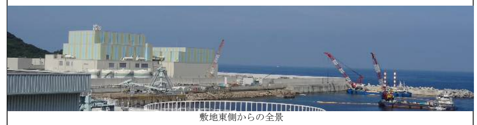
敷地東側からの全景