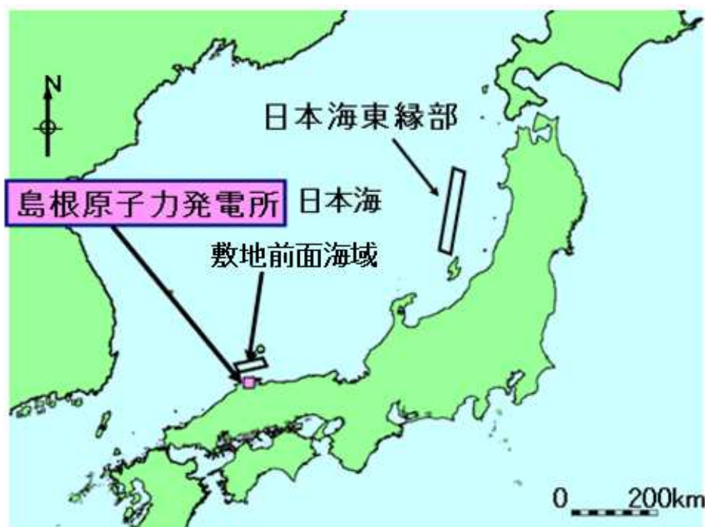
評価対象となる主な津波波源

また、取水槽内の最低水位は、海拔-7.2mであり、現在実施中の原子炉補機海水ポンプの長尺化工事により取水可能水位を上回ることを確認した。